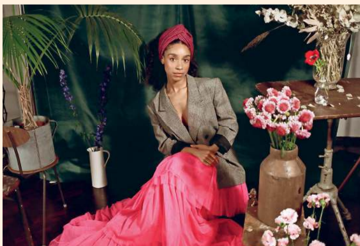
Lianne La Havas levert een intieme plaat af, met muziek die voortborduurt op spontane livejams.

Het is een sleutelsong op haar titelloze derde studioalbum dat voortuut alleen uit origineel materiaal bestaat. Ook haar versie - tempo eruit, soul erin - bereikt een apotheose bij de tekstregel 'Hit the bottom and escape'. Voor de zangeres symboliseert dat haar vlucht uit Los Angeles, waar haar relatie eindigde, en de terugkeer naar Londen. Daar lijkt ze op haar dertigste in het reine te zijn gekomen met zichzelf. Het levert een intieme plaat op met muziek die